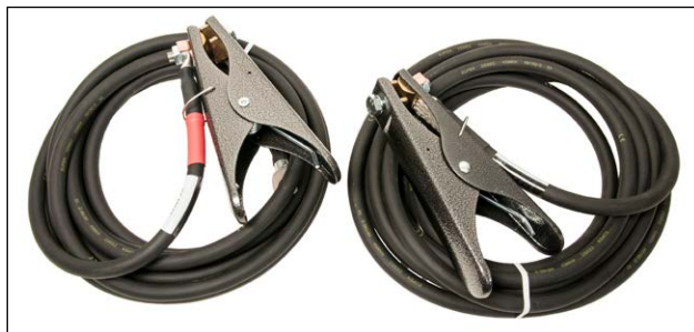
Juego de cables, GA-05052. Área de sección transversal del cable 50 mm 2