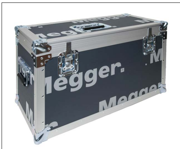
Estuche de transporte, GD-00182