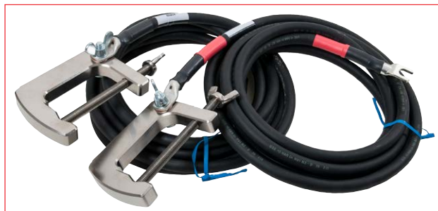
Juego de cables, GA-07052. Área de sección transversal del cable 70 mm 2 y ancho de mordaza de pinza de 100 mm. Los juegos GA-07102 y GA-09152 tienen las mismas pinzas.