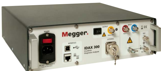
Analizador de diagnóstico del aislamiento IDAX-300

La línea IDAX de instrumentos diagnósticos de aislamiento mide el factor de capacitancia y disipación en sistemas de aislamiento eléctrico a 50/60 Hz, así como en un amplio rango de frecuencias, normalmente de mHz a kHz. La técnica de frecuencia variable se denomina mediciones de respuesta de frecuencia dieléctrica (DFR) o espectroscopia en el dominio de frecuencia (FDS). El primer instrumento de campo que emplea esta técnica, el amplificador de alta tensión IDA y VAX, se desarrolló hace 15 años y pronto se convirtió en el sistema de prueba estándar para mediciones DFR en transformadores, bushings y cables.