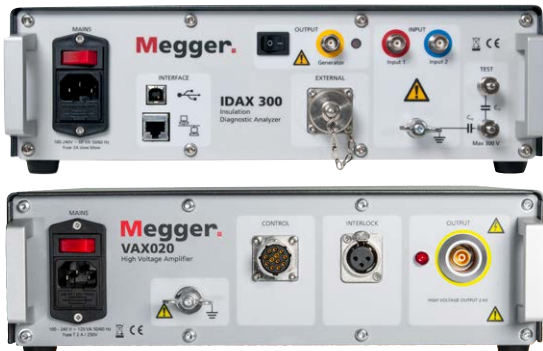
El sistema de prueba: IDAX-300 y VAX020